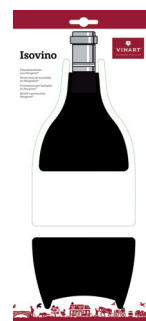
55 166 000* Isovino Protection en Néoprène pour bouteilles jusqu'à 0,75 l. Conserve vos boissons froides ou chaudes et protège la bouteille Flaschenschutz aus Neopren für Flaschen bis 75cl. Hält Ihre Getränke kalt oder warm und schützt die Flasche UV/VE: 12