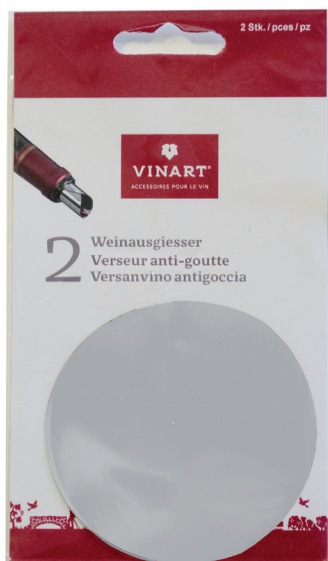
73 007 02 Stop Goutte Tropfenfänger

Verseur argenté set 2 pces Weinausgiesser silberfarbig 2er Set UV/VE: 10