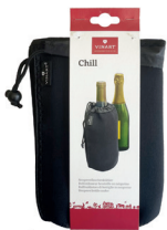
55 167 000 Chill NEW Refroidisseur bouteille en néoprène Neoprenflaschenkühler UV/VE: 6