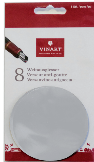
73 007 08 Stop Goutte Tropfenfänger

Verseur argenté set 8 pces Weinausgiesser silberfarbig 8er Set UV/VE: 10