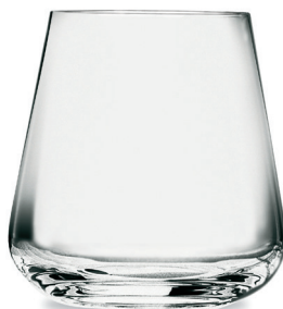
71 018 55 Multi Service

Verre tous usages Glas für alle Gelegenheiten 33 cl, H 90 mm UV/VE: 6