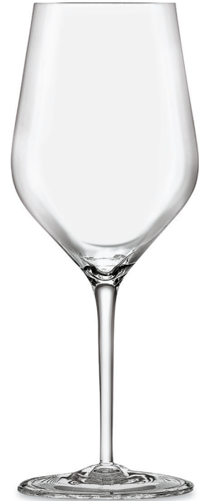
71 018 53 Magnum