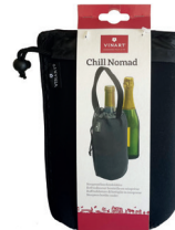
55 168 000 Chill Nomad NEW Refroidisseur bouteille en néoprène avec anse Neoprenflaschenkühler mit Griff UV/VE: 6