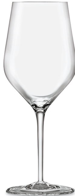
71 018 52 Medium