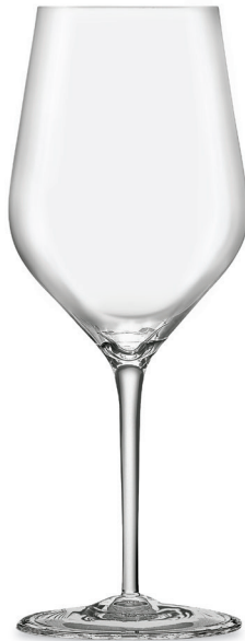
71 018 51 Basic

Une collection de verres soufflés bouche aux dimensions idéales pour vos vins blancs, rouges ou rosés. Leur design harmonieux met particulièrement en valeur les arômes les plus fins Eine Sammlung von mundgeblasenen Gläsern mit idealen Dimensionen für Ihren Weiss-, Rot- oder Rosé-Wein. Ihr harmonisches Design hebt besonders die feinsten Aromen hervor