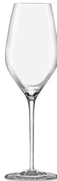
71 018 62 Champagne

Flûte perlage Champagnerglas 28 cl, H 215 mm UV/VE: 6